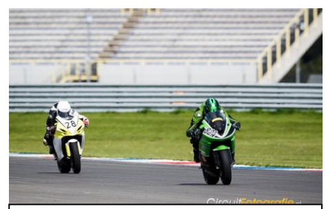
Hier zal ik later op vermogen worden ingehaald